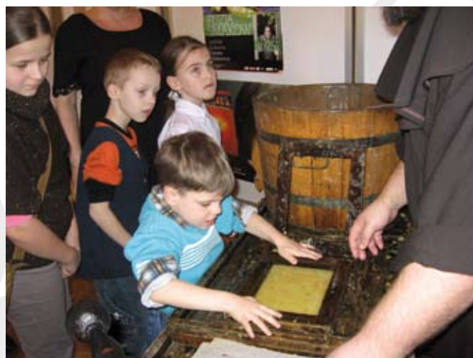
Warsztaty czerpania papieru

Uczestnicy otrzymali również ważne informacje historyczne związane z rozwojem „czarnej sztuki” przekazane w przystępnej, czasem wręcz zabawnej formie.